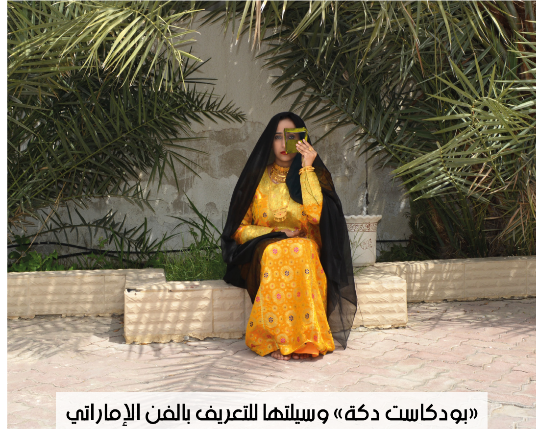
«بودكاست دكة» وسيلتها للتعريف بالفن الإماراتي

وسيلة للتعامل مع الكون، قد يكون ردة فعل، أو اللغة التي تساعدني للتعبير عن أمر ما عندما أعجز عن التعبير لغوياً. أما عن طموحي فهو الاستمرار بأن أكون فضولية حول الحياة والتعبير عن ذلك بالوسائل التي تناسبني حسب كل مرحلة من حياتي، حالياً «بودكاست دكة» هو وسيلتي.